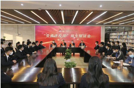
师生与劳模面对面。