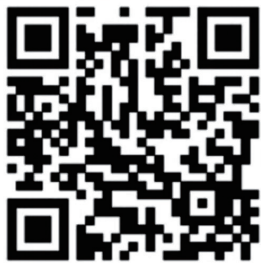
扫描二维码查看具体名单

登记为非营利性机构前,家长不要缴纳新的学科类培训费用。如市民发现违规或变相违规开展学科类培训行为,请拨打12345进行举报。 记者沈樑