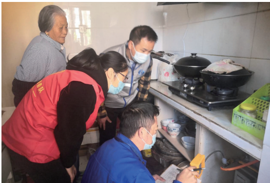
11 月 9 日全国消防日来临之际,崇川经济开发区国胜社区开展燃气检测惠民利民活动,特邀南通大众燃气公司检测人员,深入辖区企业、商铺、幼儿园以及困难群体家中进行燃气使用安全检测,为居民安全保驾护航。周小玉

据悉,11 月 9 日是第 30 个“全国消防日”,11 月也是我省法定的消防宣传月。近年来,崇川区高度重视和关心消防救援工作,全面落实各项管理措施,全力支持消防救援队伍建设,全区消防事业不断发展,基层基础有力夯实,安全生产形势保持稳定。通过开展此次活动,旨在进一步动员全社会落实消防责任,防范安全风险,积极参与消防工作,真正形成人人关注消防、参与消防、支持消防的良好局面,营造良好的消防安全环境。王非