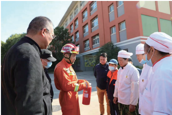
昨日,新城桥街道朝晖社区联合朝晖小学,开展应急疏散演练,孩子们在老师带领下,有序撤离至操场。消防队员还为师生做了防火、自救、消防器材使用等消防知识讲解,帮助师生提升消防安全防范能力。王亚杰