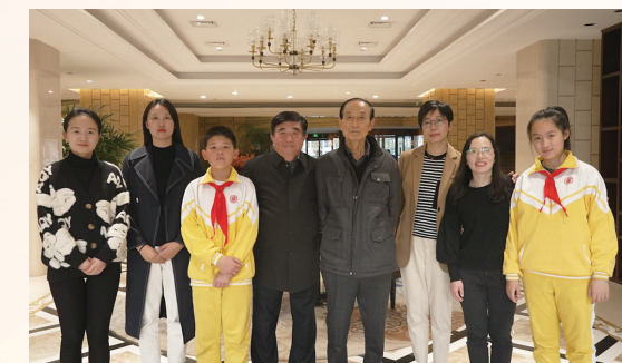
四代记者与加藤纪生合影。

38岁。再过几天,他将迎来自己的80大寿。从年近不感到杖朝之年,他在南通生活、工作了40多年,见证、亲历了南通的改革开放。 力王公司在南通大获成功后,随着产业的梯度转移,离开了南通。但更多、产业能级更高的外资企业纷至沓来。南通从一隅迈向了更广阔的世界舞台。加藤纪生也选择了留在南通。凭借其优秀的管理能力,以及对中日两国国情的了解,加藤纪生成为南通的“招商大使”、众多企业争邀的总经理。 “在他的推介下,先后有20多家外资企业在南通投资获得成功。”对于出色履历,周健如数家珍,“他是位出色的管理者,有的企业在他接手后不仅‘起死回生’,还获得全国、省级荣誉。” 抚今追昔,加藤纪生感慨不已,刚到中国,“我们根本不知道还有南通这样一个城市。”改革开放初期,到南通来投资的大多是日本中小企业;20世纪90年代起,东丽、帝人、川崎重工、王子造纸等一批日资巨头相继落户南通……如今,国际著名跨国公司在通投资早已不是新闻。 截至2020年年底,南通共吸引来自120多个国家和地区的投资者在通设立企业11703家,实际利用外资超过430亿美元,58家世界500强企业投资投资项目114个。 加藤纪生把青春年华贡献给了南通,同时也收获了美好人生。国庆41周年时,他应邀出席在北京人民大会堂举行的庆祝宴会。他是南通市荣誉市民、南通首批外籍永久居民,成为地地道道的“南通人”。 值得一提的是,20世纪90年代,加藤纪生发起促进苏通大桥早日建设的请愿签名活动。他联合醋纤、帝人、东丽等16家在通三资企业,为推进苏通大桥早日上马效力。 如今,“难通”变“通途”,加藤纪生疾呼的苏通大桥早已通车。规划中的张皋过江通道、苏通第二过江通道、海太过江通道、北沿江铁路通道、崇海通道,将与现有的崇启大桥、苏通长江公路大桥、沪苏通长江公铁大桥一起形成“八龙过江”新格局。 经历了南通的巨变,加藤纪生感叹自己这大半辈子,“命运做出了最好的选择。”他希望,南通的新机场和地铁能加速建设,让南通更“好通”! 本报记者苗蓓 张檬檬 高阳