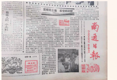
1988年6月,南通日报刊出《来自高沙土地地区的报告》系列调查报告。