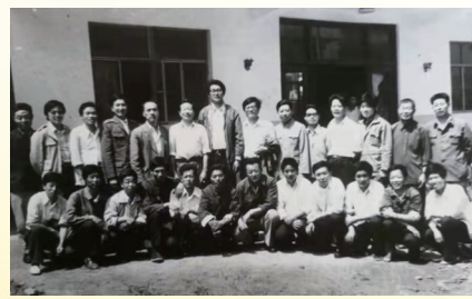
记者与当地干部群众合影。