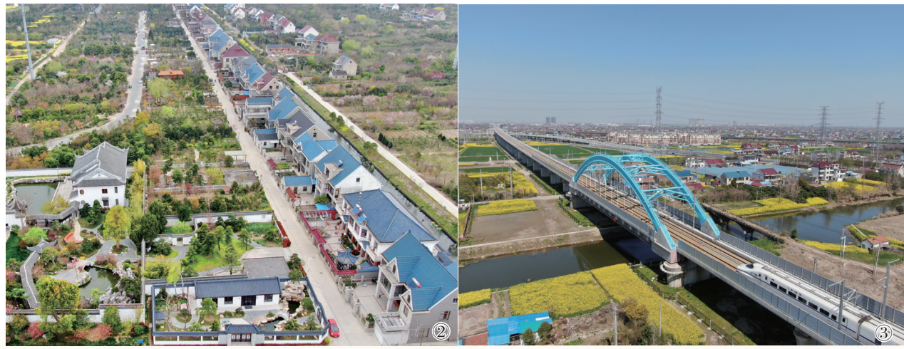
图③如皋境内盐通高铁。