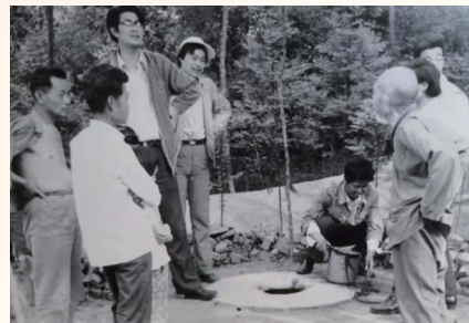
记者在贡家巷红军井采访。