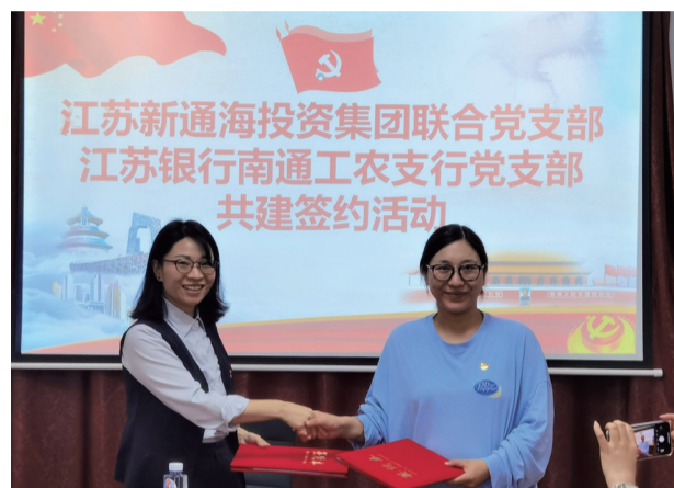
江苏银行南通工农支行党支部与江苏新通海投资集团联合党支部开展党建共建签约活动。

爱在金秋,感恩重阳。工农支行三个网点分批次举办“九九重阳节,浓浓敬老情”爱眼护眼活动。工作人员为前来办理业务的客户免费敷眼膜,有序验光,详细登记眼镜度数,眼镜制作完成后一一通知客户前来网点领取,获得了一致好评。支行以此为契机,开展“弘扬精神谱系,共建幸福家园”主题活动,进一步拉近与居民的距离,提升我行“融享幸福”品牌形象。支行员工向老年人发放《2021年金融网络安全手册》以及反洗钱、防网络诈骗等宣传折页,普及金融网络安全和个人金融信息保护等常识,营造共筑网络安全防线的浓厚氛围。