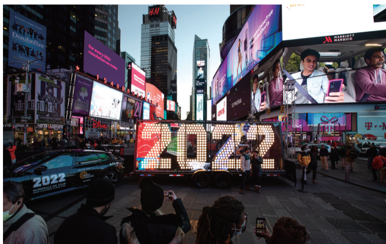
『2022』灯光装置亮相时报广场