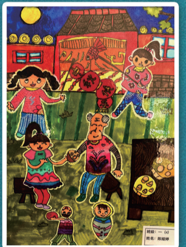
南通开发区实验小学教育集团 龙腾校区 一(4)班 陈娅婷