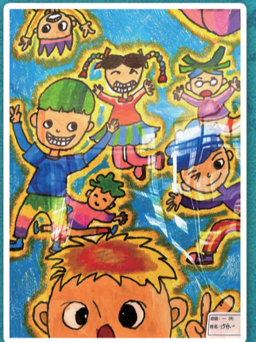
南通开发区实验小学教育集团 龙腾校区 一(3)班 沙乐一