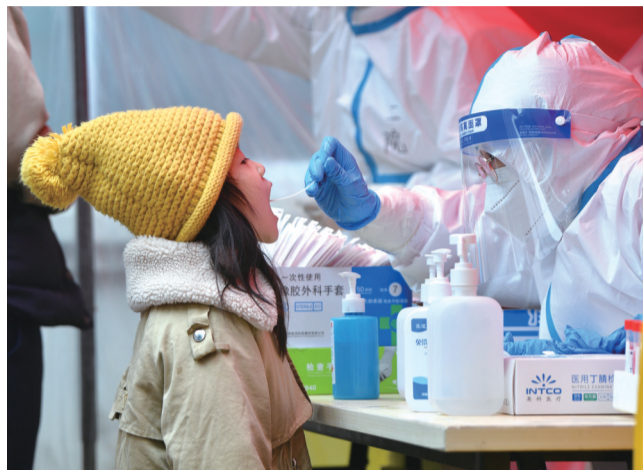
1月10日,在郑州市二七区政通路一处核酸检测点,医务人员为小朋友进行核酸检测取样。新一波疫情来袭,河南省郑州市近日连续开展多轮全员核酸检测,6000多个采样点位开足马力进行核酸采样。