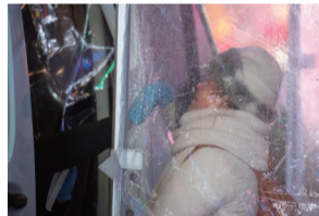
一名受检者在美国纽约时报广场一处新冠检测点接受检测。

数据显示,美国累计确诊病例于2020年11月9日超过1000万例,2021年1月1日超过2000万例,3月24日超过3000万例,9月6