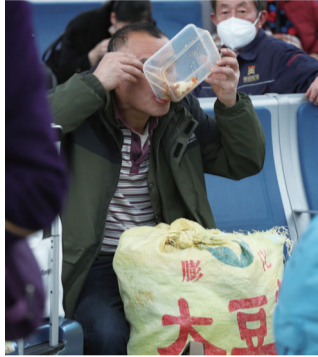
24日在南通火车站拍摄的返乡旅客候车“百态”。

晚报讯 昨天,记者从市交通运输局获悉,春运首周(1月17日~1月23日),我市共安全发送旅客305888人次,相较2021年同期同比增长88.46%。其中,公路发送旅客143927人次,铁路发送旅客137225人次,民航发送旅客24736人次。