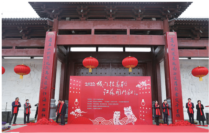
狼山门前的巨幅春联。记者许丛军

晚报讯 “喜九域逢春,花雨无边,厚蔚云霞千里锦;看五山拱翠,风流万丈,遥呼江海一轮红。”“钟振长空,腾啸虎精神,千帆竞发南通港;楼盈春色,呈雕龙笔墨,万众喜迎中国年。”昨天,两副巨幅春联同时亮相狼山与钟楼,为通城增添了年味。