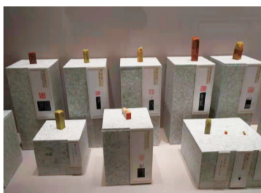
遥望西泠——西泠印社社员作品展