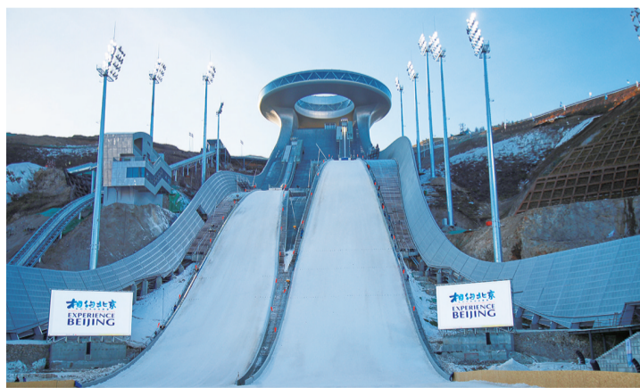
◀ 建设中的“雪如意”。 ▼ “冰丝带”外景。