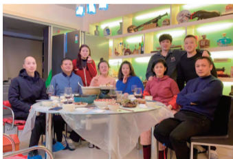
“三姐妹”与家人家宴合影。