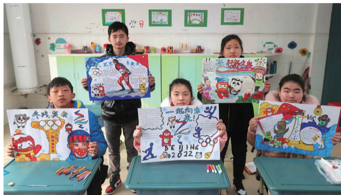
特教中心聋部组织学生开展“童心向未来,我爱冬残奥”手抄报活动。

连日来,在素有“体育之乡”“世界冠军摇篮”美誉的南通,热心市民、中小学生和残疾人朋友等踊跃参加各类主题活动,喜迎北京冬残奥会开幕。