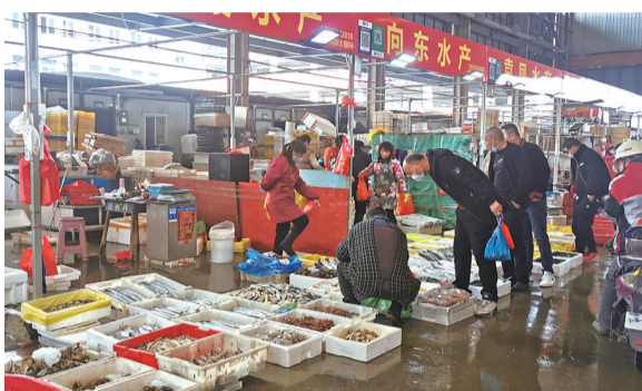
水产鲜活进入销售旺季。 记者严春花