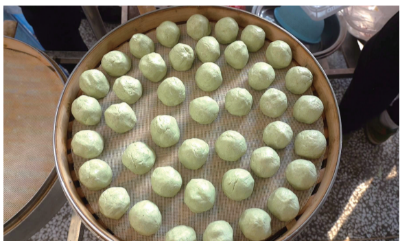
蒿团成为春天的时令美食。