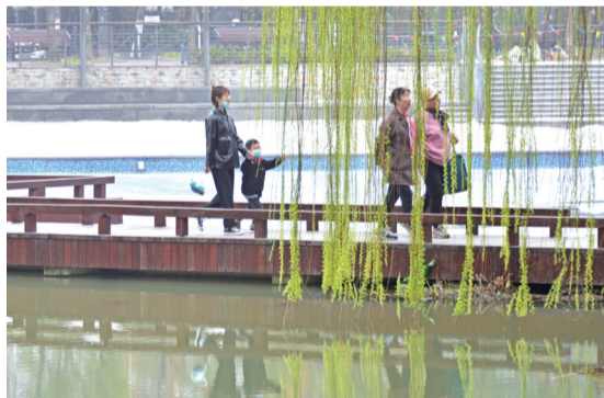
市民正在濠河边漫步。 丁传彬

晚报讯 “十里濠河,烟柳画廊。”昨天早晨,通城笼罩在白茫茫的雾气中,为千年濠河带来了些许韵味。随着气温的升高,醉人的春风宛如一双灵巧的手,用画笔轻轻地给万条垂柳点上了绿色的小嫩芽,似绿帘如丝带,在习习春风里婀娜多姿,水墨画一般气韵生动,煞是好看。