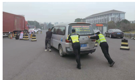
交警帮忙将车推出检查点。

晚报讯 疫情查控,温情不减。13日,南通交警高速二大队民警在沈海高速小海收费站疫情查控服务点执勤时突遇一辆抛锚的汽车,立即出手相助。