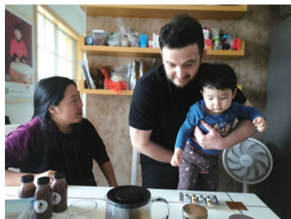
双城之恋的幸福瞬间。