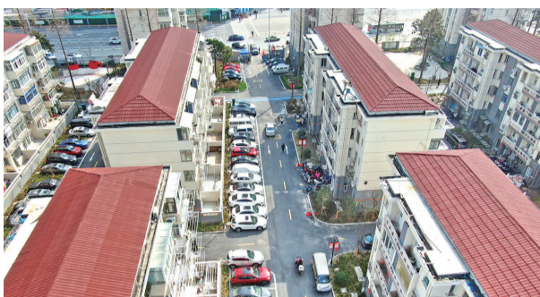
崇川区改造后的老旧小区「颜值」颇高。