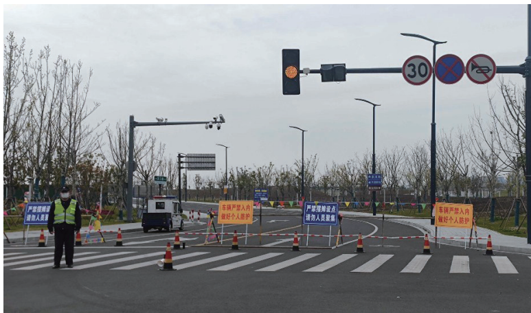
昨天，滨江花海景点路口设障。

晚报讯 清明小长假期间，天气晴好。4日，网上流传的一张市民在南通狼山国家森林公园滨江花海景点扎堆露营的图片，引起了大家的关注和热议。昨天，记者来到了滨江花海景点发现，管理方已经在现场设置了隔离栏，滨江公园也临时封闭，不再对外开放，人员扎堆的景象已不复存在。