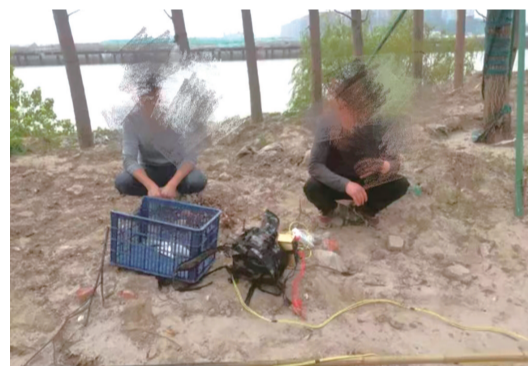
被抓获的违法电鱼嫌疑人。