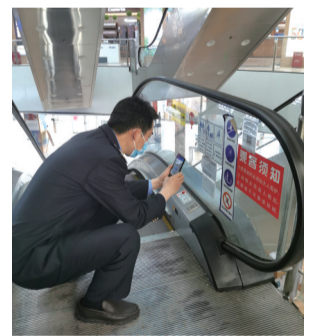
和平桥分局党员开展特种设备检查。