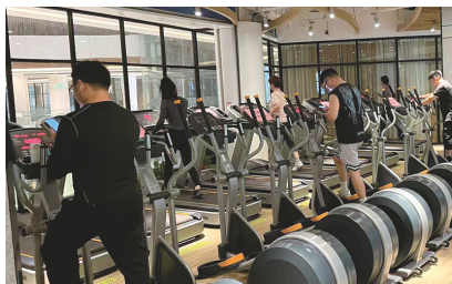
市民有序健身。