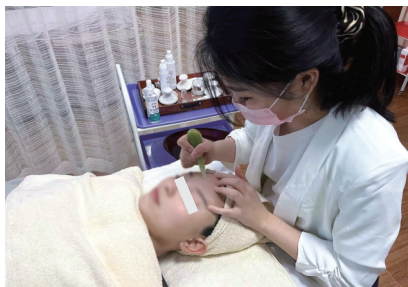
美容师为顾客提供服务。

“在美容院复工的第一天实现了自己的愿望,心情还是很愉快的。”今年37岁的汤女士是唯诺美容养生会所的常客,在得知美容养生机构恢复