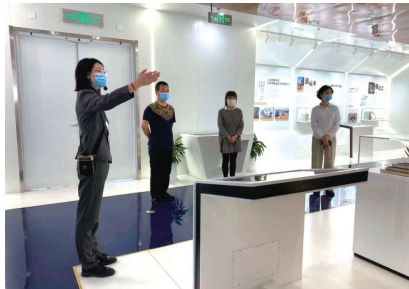
市文化馆工作人员为市民讲解。

闭馆期间,市文化馆坚持“闭馆不闭展”,为市民提供“云观展,听讲解”活动;“五一”长假,又通过线上平台推出“云展播”活动,持续满足市民的文化生活需求。正式运营以后,文化馆公共文化服务工作继续推进,在开展“云展览”“云剧场”“云课堂”系列活动之外,将常态化开展“文化江海行”品牌活动,有序举办第十六季“百姓戏台周周演”活动,线上推进