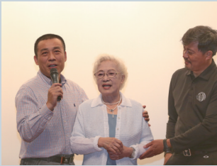
2015年9月10日,由秦怡主演的电影《青海湖畔》在通首映。

在世人眼里,秦怡的人生无疑是值得羡慕的,她外形美丽、事业成功,且活到100岁,是真正的长寿有福之人。然而,从秦怡的不少访谈中得知,她经历过许多不为人知的人生磨难。婚姻不顺,儿子精神有恙,她的人生充满坎坷。但出现在公众场合的秦怡,永远银发红唇、温和优雅,她把脆弱的一面留给自己,把美好的一面带给大家,我想秦怡身上最让人佩服的形容词应该是:坚强。