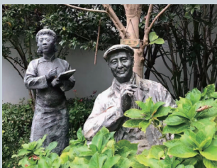
秦怡和赵丹在《遥远的爱》里的剧照雕塑。