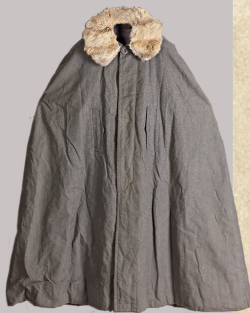
谢觉哉在延安时期穿过的羊皮大氅