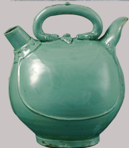
越窑青瓷皮囊式壶