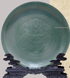
“混元三教九流图”大型瓷盘