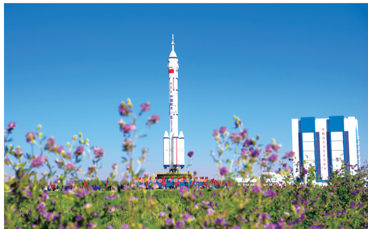
神舟十四号即将发射

5月29日,神舟十四号载人飞船与长征二号F遥十四运载火箭组合体正在转往发射区途中。当日,神舟十四号载人飞船与长征二号F遥十四运载火箭组合体已转运至发射区。