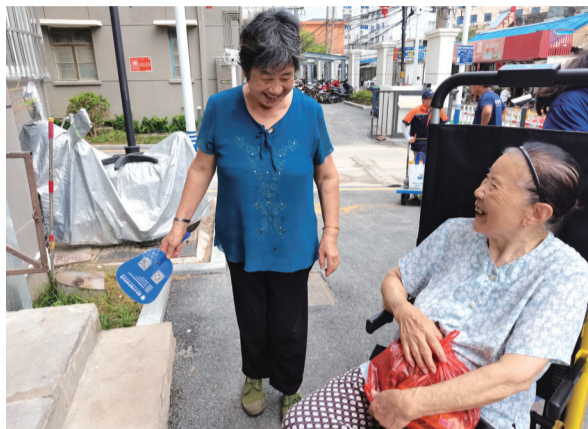
「悬空老人」在楼下与邻居畅聊。 记者俞鑫城

高温天气对老人造成的影响,以及老人们的作息规律,我们将服务时间调整至清晨或下午4点以后。”社工员孙顾熙告诉记者,使用爬楼机接待服务老人前,工作人员严格遵循“一人一消”原则,对机器进行消杀,并全程佩戴口罩,认真做好防疫措施。爬楼机的操作使用由两名工作人员共同完成:经验老到的师傅亲自负责扣安全带、启动机器等所有重点环节,确保服务过程不出现差错;上下楼过程中,社工员时刻关注老人的身体、精神状况,并适时给予老人安慰。“如果老人第一次使用爬楼机,我们还会给他们播放特制的教学视频,向他们解释爬楼机