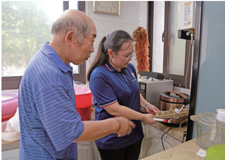
昨天,钟秀街道中心村社区“红满中心”在职党员志愿者开展上门服务,为辖区老年居民进行燃气安全测试,确保夏季用气安全。 张志陆