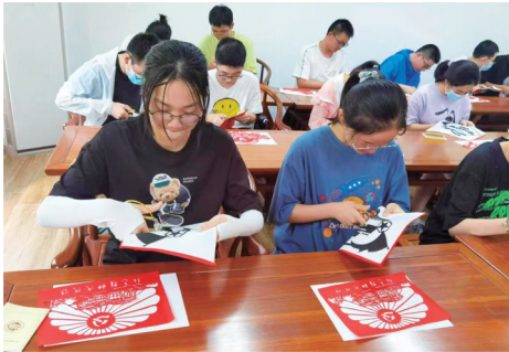
昨天,文峰街道果园村社区开展“巧手心向党·喜迎二十大”主题剪纸活动。孩子们现场聆听革命故事,在非遗传承人指导下进行剪纸创作,进一步传承红色基因,厚植爱国爱党情怀。 黄锦杰