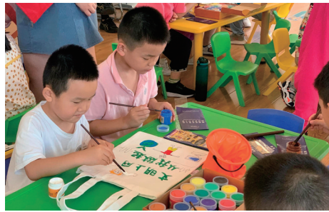
8日,狼山镇街道闸桥社区开展“安全上网 e路童行”活动。孩子们齐声诵读《文明上网倡议三字经》,并以“网络安全”为主题绘制环保袋,进一步营造良好网络生态,争做文明小网民。 顾誉