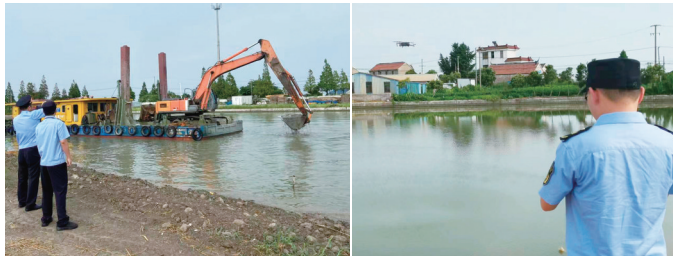
处置现场。

晚报讯 南通市交通运输综合行政执法支队如东大队统筹金鑫交通和江苏通航几方力量,经过5天紧张作业,至16日下午,将洋口运河八号桥东侧水下“咬人”的障碍物成功清理。此次行动如东大队使用了无人机和声呐探测器对目标进行精确快速定位,对指导施工作业和判明作业效果发挥了非常积极的作用。