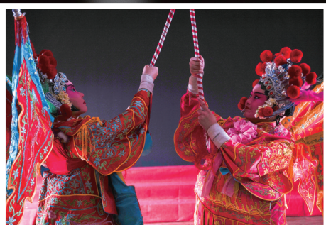
两名扮演穆桂英的小营员在“经典体验”环节切磋动作。

一名扮演白娘子的小营员难耐勒头(京剧上妆方式)之痛,但她还是咬紧牙关完成了演出。