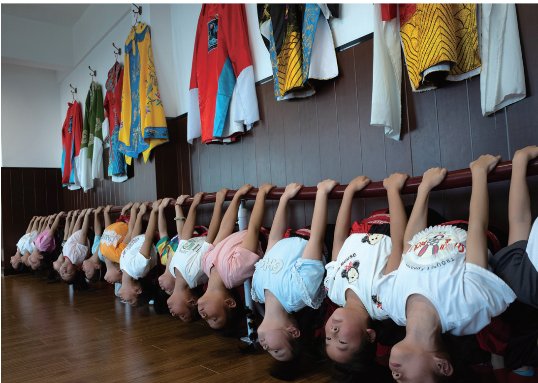
京剧夏令营的孩子们在苦练基本功。