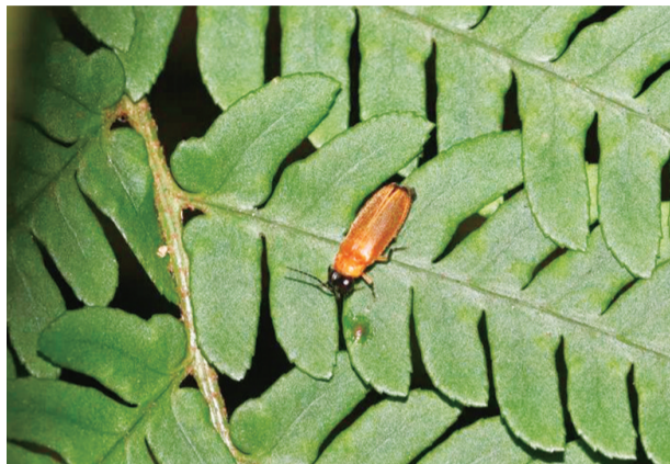
本次发现的萤火虫(黄脉翅萤)种群。

自2021年起,由南通市生态环境局牵头,联合南京大学环境规划设计研究院生物多样性团队在五山滨江片区持续开展生物多样性年度观测工作。本次夏季调查工作中,依托军山固定观测样地、长江湿地固定观测样地等基础设施,植物类群共计完成6条样线踏查,及9个草本样方、5个灌木样方、3个乔木样方的调查。鸟类共计完成6条样线和9个样点的踏查观测。哺乳动物共计完成6条样线踏查观测,以及5台红外相机的数据收集。陆生昆虫共计完成5条样线踏查,以及1处灯诱点和1处马来氏网的数据采集。淡水水生生物