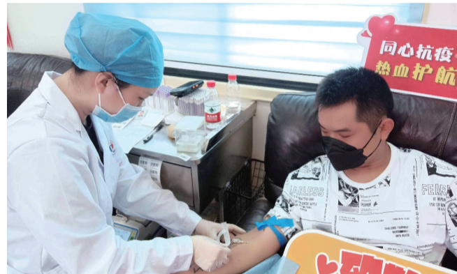
市民献血场景。 通讯员张凌霄

晚报讯 皎皎中秋月,殷殷热血心。短短3天小长假,截至12日下午5时,通城共有432位爱心人士为爱举手,共计399人捐献全血14.45万毫升,33人捐献单采血小板59个单位。热心市民们通过无偿献血的方式助力万家团圆,让这个中秋佳节更添暖意。