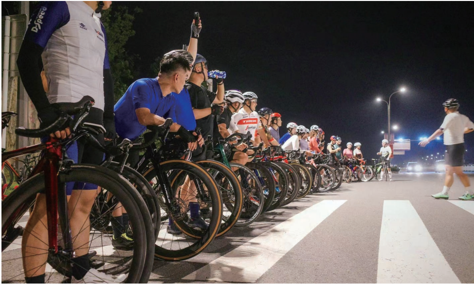
我市骑行爱好者集结准备出发。