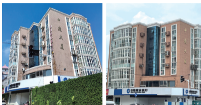
中建大厦改造前 中建大厦改造后

目前文峰大厦和华泰大厦的提升改造工程正在稳步推进。其中,文峰大厦已进入腰线粉刷阶段,华泰大厦正在粉刷面漆、店招换新,二者预计将在本月底完成改造。记者江妹颖