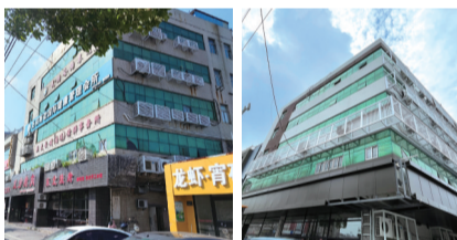
新通海大厦改造前 新通海大厦改造后