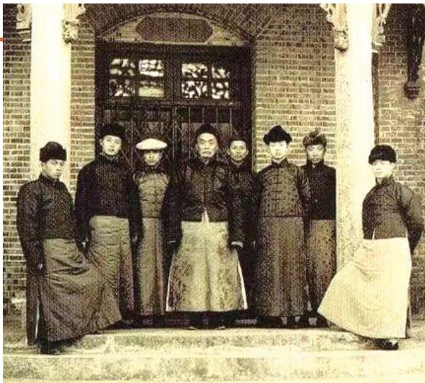
1920年,张謇(左四)和梅兰芳(右三)、欧阳予倩(左三)等合影于南通。