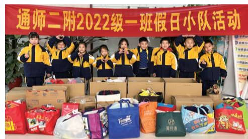
孩子们在物资前合影。

晚报讯 “让我们一起伸出援助之手,为大凉山的小伙伴们献出一份力所能及的爱心。”近日,气温骤降,寒风让人缩手缩脚。而一封来自通师二附一(1)班的《倡议书》温暖了同学们的心,更温暖了远在千里之外的大凉山的小朋友。