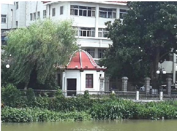
通明电气公司八角亭。