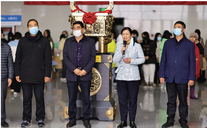
校领导和部门负责人在创新创业集市上讲话。

120年前,清末状元张謇先贤怀着“开民智、明公理、强人才”的爱国思想,创办了我国第一所独立设置的师范学校——民立通州师范学校(南通师范高等专科学校的前身),对人才的渴求之心,可见一斑。自此以后,这所从创校伊始就肩负育才报国使命、自带创新创业基因的师范学校,在办学探索过程中,始终秉承“开风气之先”的优良传统,从引进西方师范教育模式到形成本土化师范教育体系,从沿袭技术性师范教育到倡导人格化师范主张,先后创造了诸多的“全国第一”,为我国师范教育的改革作出了原创性的贡献。尤其在乡村师范生和定向师范生教育方面,被视为全国基础教育的典范,也在教育界享有“红色师范”“教师摇篮”的美誉。