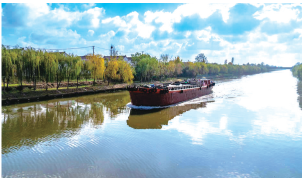
本报见习记者沈佳颖 张园整理

针对丁先生反映的问题，下线之后我们会立即到实地了解具体情况，与当地镇村共同研究该河流为何要填、是否能填、填后水系如何替代，以及有何解决措施。