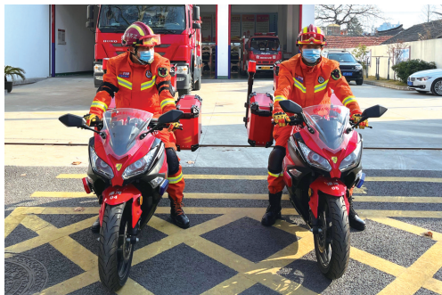
消防队员出勤巡查。 记者李慧

除夕，寺街、西南营纵横交错的小巷里张灯结彩，南大街人群熙熙攘攘，年味儿甚浓。一早，崇川区濠河专职消防救援队的消防队员们便兵分两路，一路在南大街陈兵，一路进行日常的防火巡查和入户宣传。消防一车5人在南大街陈兵点，随时待命；另2人骑着消防电摩穿梭在小巷中，挨个仔细检查消火栓和灭火器，巡查商铺是否存在安全隐患。