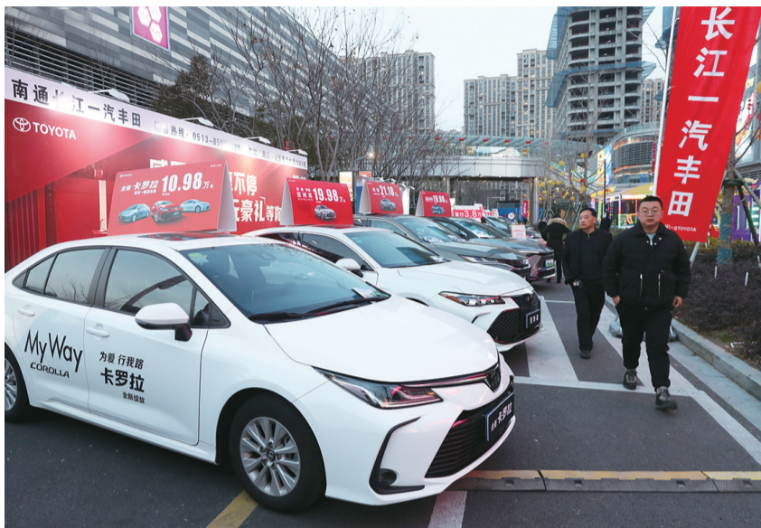
汽车博览会现场。

“宝马雕车香满路。凤箫声动,玉壶光转,一夜鱼龙舞。”用辛弃疾的《青玉案·元夕》,来形容昨晚在开发区能达商务区星湖城市广场举办的南通开发区首届汽车博览会,可谓贴切之至。