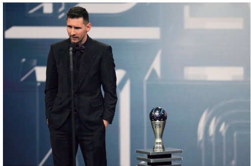
2月27日,梅西发表获奖感言。

据新华社巴黎电 2022年国际足联年度最佳荣誉颁奖仪式2月27日在巴黎举行,阿根廷前锋梅西再次获得年度最佳球员奖,阿根廷队成为本次颁奖典礼上的最大赢家。梅西上一次获得这个奖项是在2019年,过去两年(2020、2021)这个奖获得者都是波兰球员莱万多夫斯基。 单磊