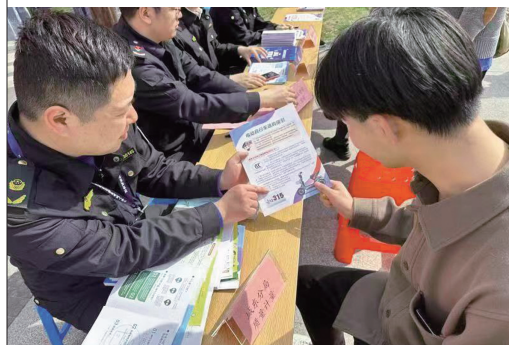
昨天,城东街道南园社区联合市场监管局城东分局,在蓝印花布博物馆前举行“3·15消费者权益日”活动。 金霞