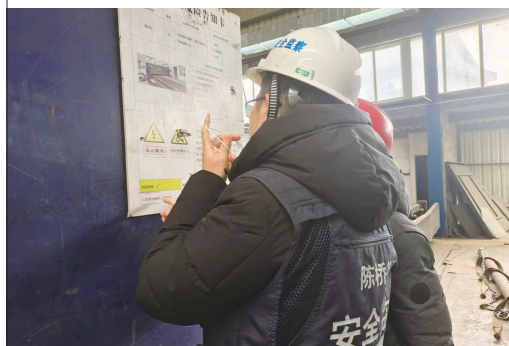
近日,陈桥街道育爱村邀请安全专家充当企业安全生产“啄木鸟”,走进辖区企业进行隐患排查,助力企业安全生产。 陈飞