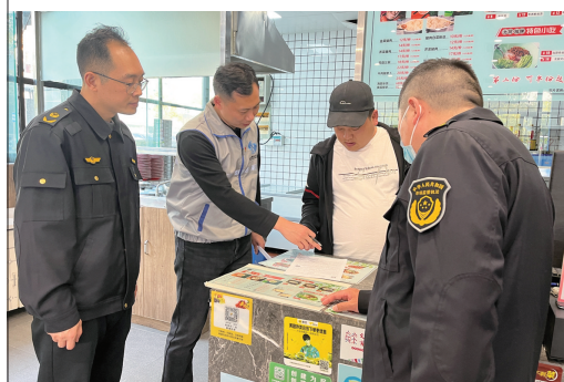
11日,崇川区市场监管局钟秀分局联合钟秀街道工会、监委会,在苏建花园餐饮一条街开展燃气安全隐患专项督查活动。 翟久茜