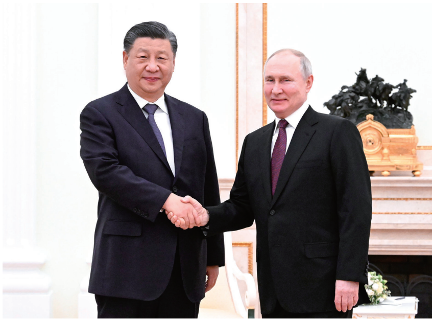
当地时间三月二十日下午,刚刚抵达莫斯科的国家主席习近平应约会见俄罗斯总统普京。