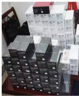
▲ 涉案赃物。 ◀ 现场侦查。

晚报讯 3月29日下午1时,如皋市公安局刑事犯罪侦查中心传来好消息:5小时,城区手机店系列被盗案告破!跨越近千公里,民警将涉嫌盗窃如皋城区4家手机店的4名犯罪嫌疑人抓获归案,起获全部涉案赃物,涉案价值100余万元。当地以刑事犯罪侦查中心为统领的现代侦查打击模式再次跑出“加速度”。