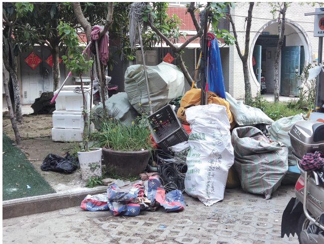
新港花苑垃圾乱堆乱放。见习记者沈佳颖

处堆放点，看到了几捆麻袋、废弃塑料筐和一些泡沫箱。附近的几名居民向记者表示，这些杂物并非一直堆在这里，一般隔两天就会清理掉。