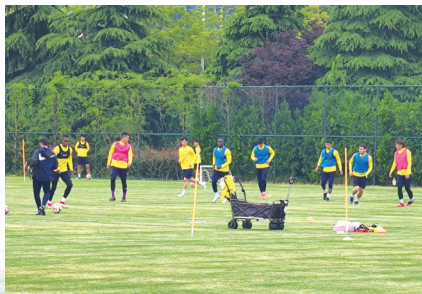
昨日，支云将士备战主场首秀。