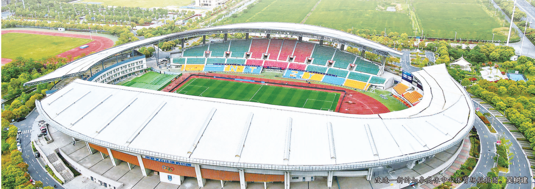
改造一新的如皋奥体中心体育场航拍图。吴树建