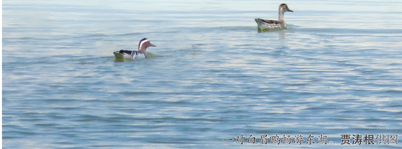
一对白眉鸭畅游东湖。

也在这里收羽歇足,时常出现万鸟齐飞、“鸟浪”翻涌的壮观景象。今年年初,如东县生态环境局开展沿海滩涂生物多样性热点区域鸟类监测调查,记录到包括国家一级重点保护野生动物黑嘴鸥在内的8种珍稀濒危鸟类1245只,并首次记录到斑头秋沙鸭、白眼潜鸭等种类。