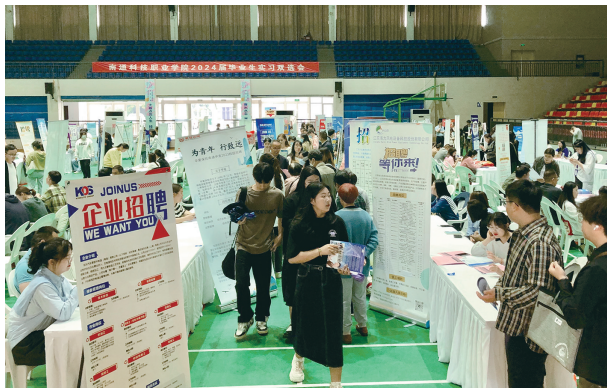
招聘会现场人头攒动。

雷颖是南通科院环境艺术设计大二的学生,想找个专业对口的单位实习,“现场招聘会可以让自己提前进入找工作的状态,了解企业需要什么样的人。”渠建国是南通职业大学的学生,正在准备升本考试,想先找一份工作,“南通的就业环境比较好,工资待遇也比山西老